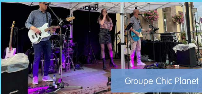
Groupe Chic Planet