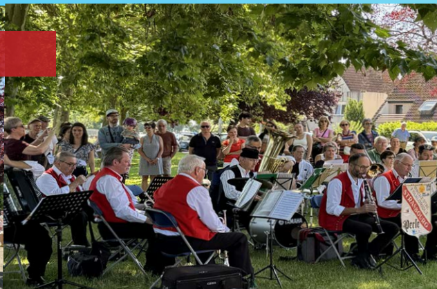
Orchestre Perle de Strasbourg