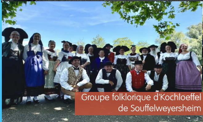
Groupe folklorique d'Kochloeffel de Souffelweyersheim