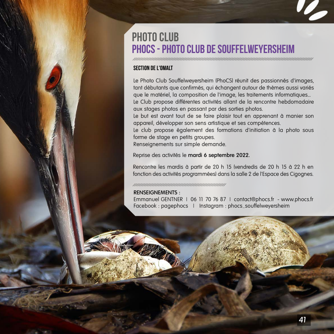
PHOTO CLUB PHOCS - PHOTO CLUB DE SOUFFELWEYERSHEIM